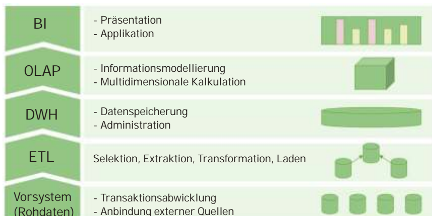
Die Bestandteile eines BI Projektes

Neben einer damit verbundenen, nicht unerheblichen, finanziellen Investition ist dieses Vorgehen für alle Beteiligten auch mit zeitlichen Investitionen verbunden. D.h. bei der Einführung eines BI Systems sind zum einen die Anfangsinvestitionen hoch und zum anderen kann der Erfolg erst im Laufe der Praxisphase beurteilt werden. Das macht jeden Business Case schwierig und legt den ROI in weite Ferne.